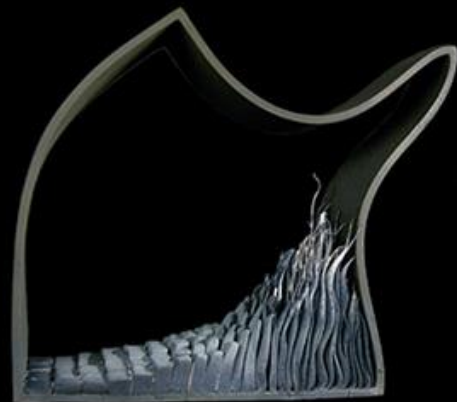
Tetramorfosis . Modelat a mà. Gres negre i porcellana, pigments i esmalt mat. 1240°C. 52cm x 46cm x 11cm.

L'encert de l'escultura d'Alberto Bustos és que es donen una sèrie de coincidències astrals, en que els planetes s'alineen i li són favorables per a l'eclosió de l'ou. Conceptualment la seva obra és pot considerar figurativa impressionista, ja que en principi s'inspira en la natura, però no la copia. Ell realitza