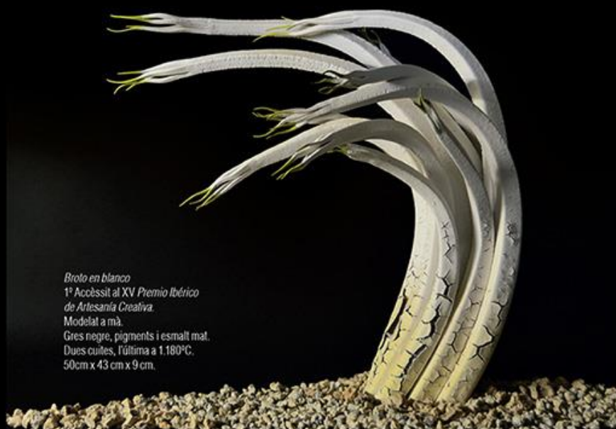
Broto en blanco 1 er Accèssit al XV Premio Ibérico de Artesanía Creativa. Modelat a mà. Gres negre, pigments i esmalt mat. Dues cuites, l'última a 1.180°C. 50cm x 43 cm x 9 cm.